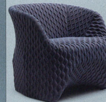
Poltrona Uma. Former/Busnelli